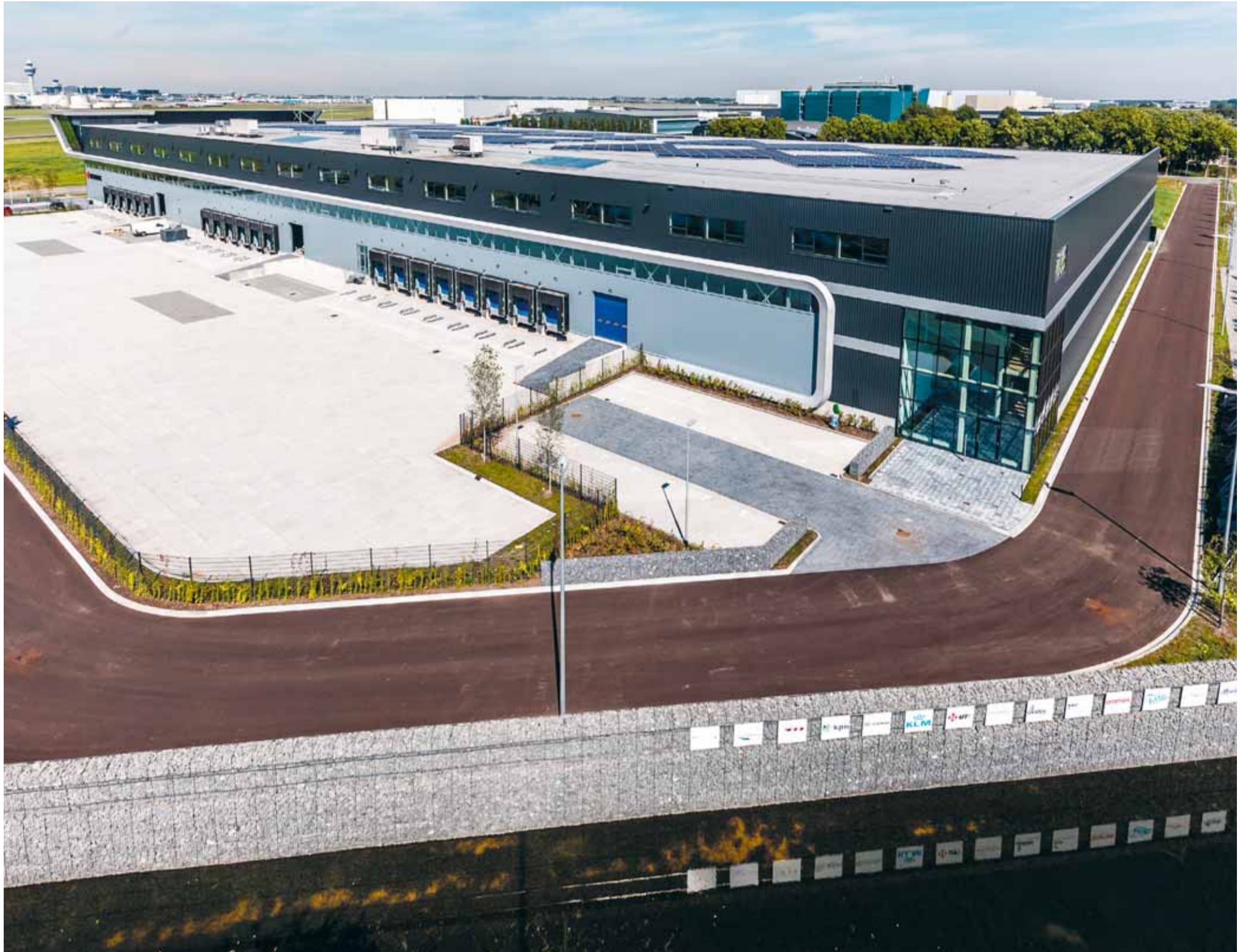
Panalpina Group huurde 6.852 m 2 bedrijfsruimte aan de Fokkerweg 300 in Oude Meer. Industrial Real Estate Partners adviseerde de verhuurder.