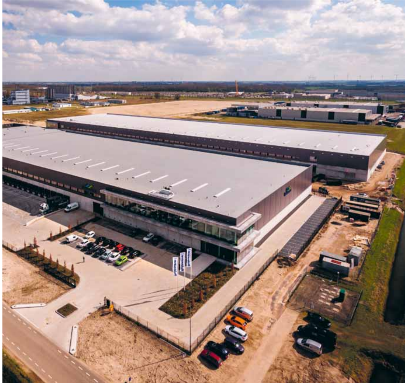
Matrix Fitness huurde 26.000 m 2 bedrijfsruimte op Smartlog Moerdijk 2 en werd daarbij geadviseerd door BCL Real Estate.

Regio Amsterdam: Amsterdam, Amstelveen, Diemen en Ouder-Amstel; regio Rotterdam: Rotterdam, Schiedam en Capelle aan den IJssel; regio Den Haag: Den Haag, Voorburg en Rijswijk; regio Utrecht: Utrecht-stad, Vleuten, De Meern en Maarssen; regio Noord-Oost: Groningen, Friesland, Drenthe, Overijssel en Gelderland; regio Midden: Flevoland en Utrecht exclusief regio Utrecht; regio West: Noord- en Zuid-Holland exclusief regio's Amsterdam, Rotterdam en Den Haag; regio Zuid: Noord-Brabant, Zeeland en Limburg.