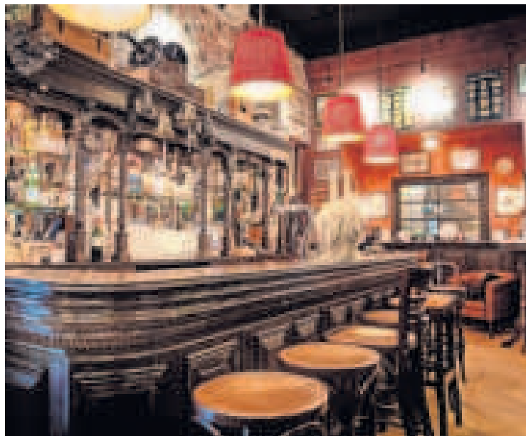
▲ Rever, dat bedrijfsinterieurs realiseert, telt 35 mensen en 20 bureaus. Het kantoor heeft er meer de functie van clubhuis, met onder meer een kroeg om te vergaderen en successen te vieren.

is voorstander. Ze schreef eerder het boek Werken doe je maar thuis , met daarin tips om te overleven op kantoor. „Mensen noemen mij een kantoorhater, maar dat ben ik niet. Ik vind het kantoor gezellig, en ideaal om bij te kletsen, e-mails te controleren of de laatste stand van zaken te bespreken. Het is alleen totaal ongeschikt om er écht te werken.”