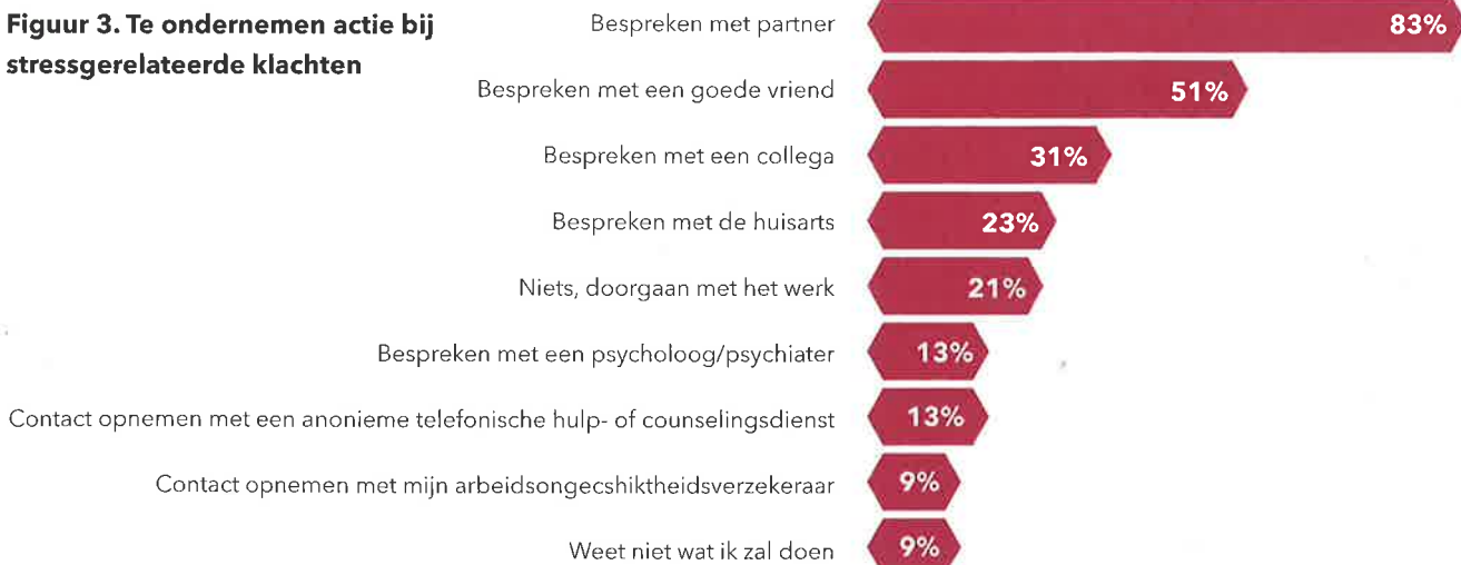
Figuur 3. Te ondernemen actie bij stressgerelateerde klachten