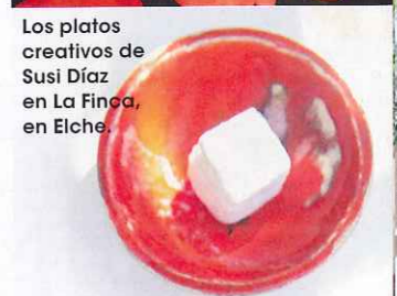
Los platos creativos de Susi Díaz en La Finca, en Elche.