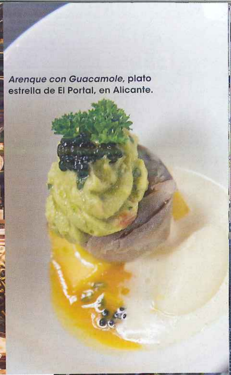
Arenque con Guacamole, plato estrella de El Portal, en Alicante.