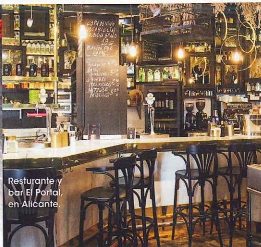
Restaurante y bar El Portal, en Alicante.