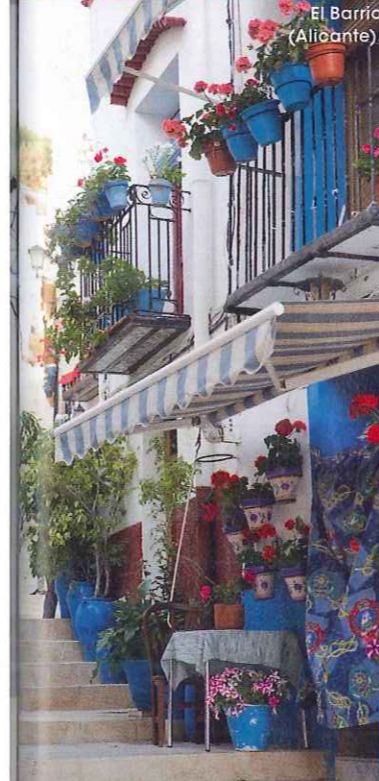
El Barrio (Alicante).