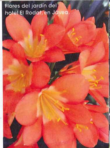
Flores del jardín del hotel El Rodat, en Jávea.

Tabarca Coge un taxi barco desde Alicante para descubrir el imponente arenal de esta reserva de la biosfera y degustar el caldero , un plato de arroz y pescados. ¡Querrás quedarte! ( costablanca.org ).