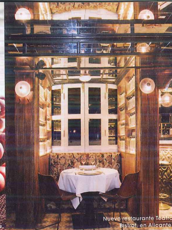
Nuevo restaurante Teatro Bistró, en Alicante.