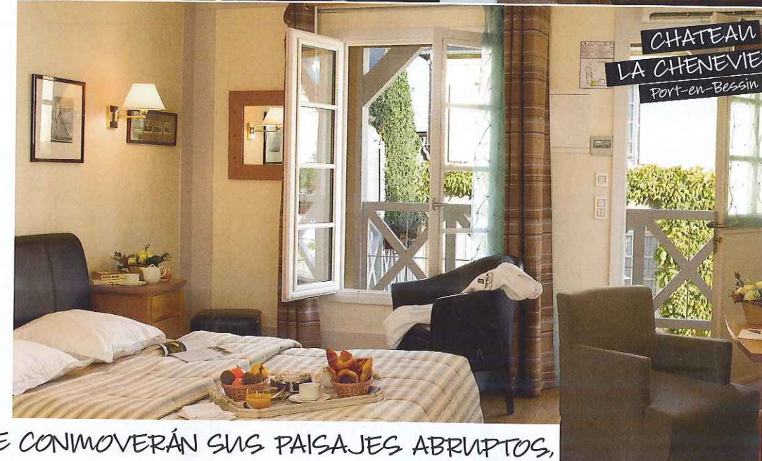
CHATEAU LA CHENEVIERE Port-en-Bessin