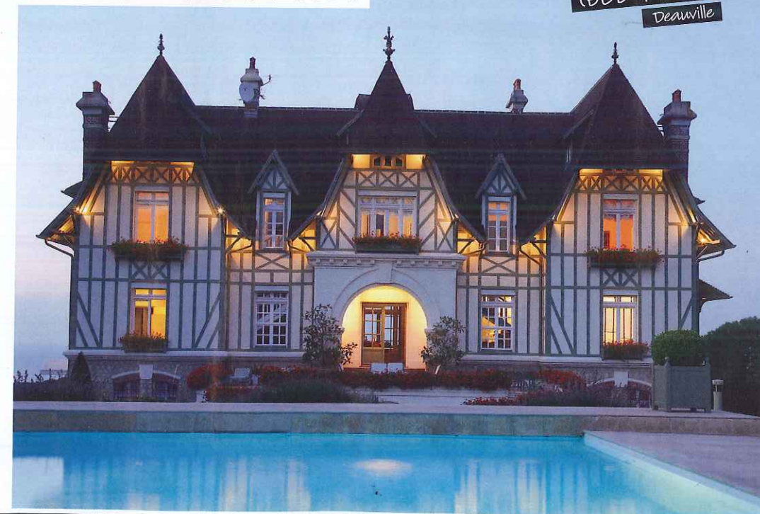
MANOIR DE BENVILLE (BED & BREAKFAST) Deauville

TE CONMOVERÁN SUS PAISAJES ABRUPTOS, LA CALMA DE SUS PLAYAS Y LA CARGA HISTÓRICA DE SUS MUSEOS