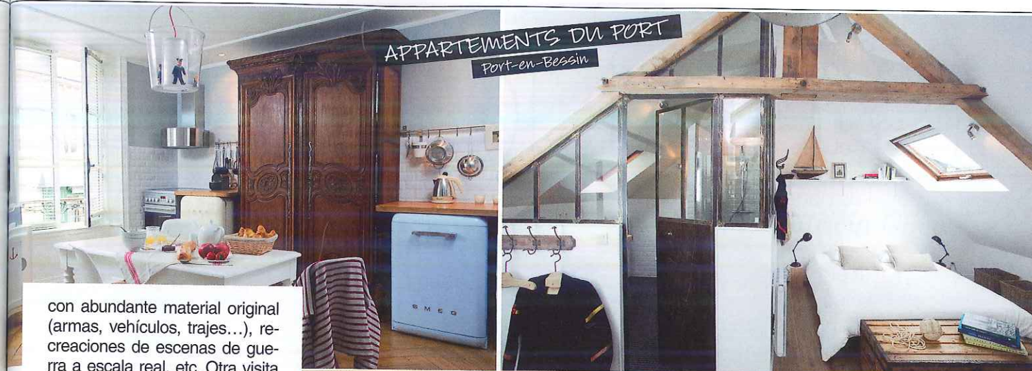
APPARTEMENTS DU PORT Port-en-Bessin

ponibles más de 2.900 alojamientos en Normandía. PLAYAS CON HISTORIA Si quieres recorrer las playas del Desembarco de Oeste a Este, comienza por Utah Beach , situada entre las localidades de Pouppeville y La Madeleine. Aprovecha también para visitar el Museo del Desembarco de Utah Beach, donde podrás ver un bombardero B26, y el Musée Airborne. Omaha Beach , conocida como Bloody Omaha por la crueldad de la batalla, se extiende a lo largo de 8 km. entre los pueblos de Vierville-sur-Mer, Saint-Laurent-sur-Mer, Colleville-sur-Mer y Honorine-des-Pertes. Aquí es parada obligatoria el Museo Memorial,