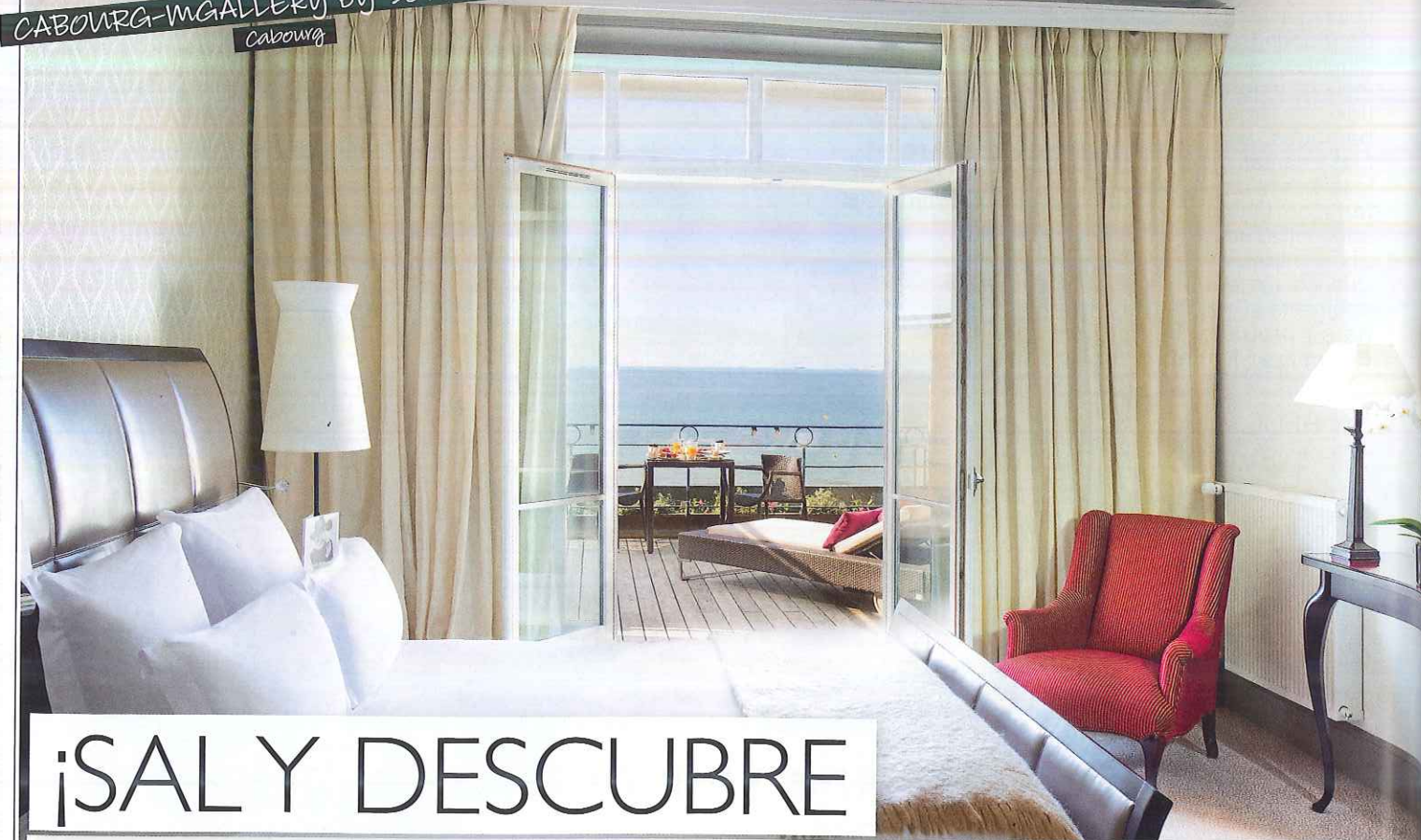
LE GRAND HOTEL CABOURG-MGALLERY BY SOFITEL Cabourg